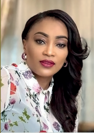
DANIÈLE SASSOU NGUESSO